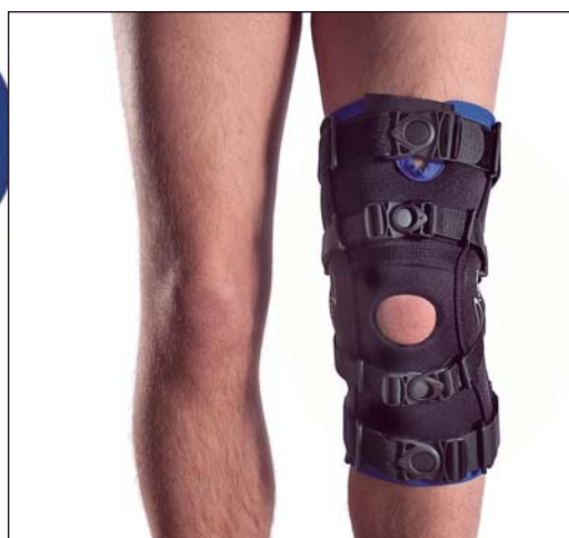
EU4511 GENUM LIGA X PLUS

X-SMALL 29-32 centimeter SMALL 32-35 centimeter MEDIUM 35-38 centimeter