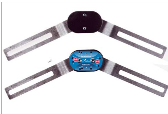
DEROYAL GENUM ROM LED

Banden justeras i längd första gången vid applicering. Därefter används snabbspännet för att ta av och på ortosen. Snabbt, enkelt och effektivt! Delar av modellerna är också utrustade med vår nya DeRoyal Quad-Strap för att förhindra att de glider ner under aktivitet. ■