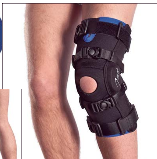
EU4509 GENUM LIGA ROM PLUS

SMALL 32-35 centimeter MEDIUM 35-38 centimeter