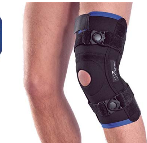
EU4513 GENUM LIGA LIGHT PLUS

X-SMALL 29-32 centimeter SMALL 32-35 centimeter MEDIUM 35-38 centimeter