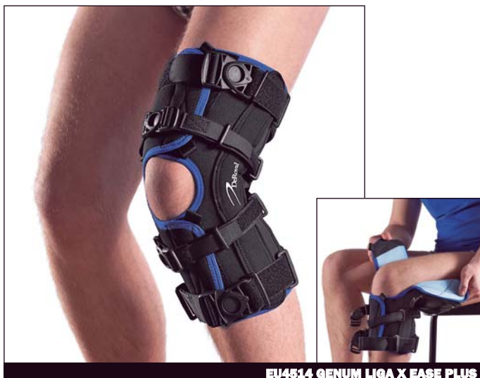
EU4514 GENUM LIGA X EASE PLUS