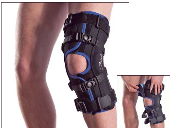
EU4518 GENUM LIGA ROM EASE PLUS

LARGE 32-42 centimeter X-LARGE 42-46 centimeter XX-LARGE 46-50 centimeter